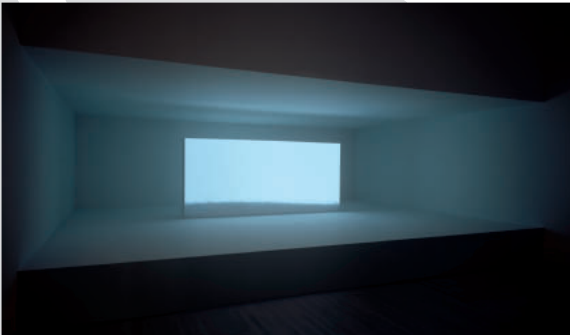
Pascal Grandmaison, Air (2006), installation dimensions variable. Purchased 2008 with the Joy Thomson Fund for the Acquisition of Art by Young Canadian Artists, National Gallery of Canada Foundation. NGC Pascal Grandmaison, Air (2006), installation aux dimensions variables. Acheté en 2008 avec le Fonds Joy Thomson pour l'acquisition d'œuvres d'art de jeunes artistes canadiens, Fondation du Musée des beaux-arts du Canada. MBAC

Bien que pratiquant chacun une forme d'art extrêmement personnelle, tous ces artistes ont en commun une qualité avec Thomson : ils défient les conventions et explorent les concepts