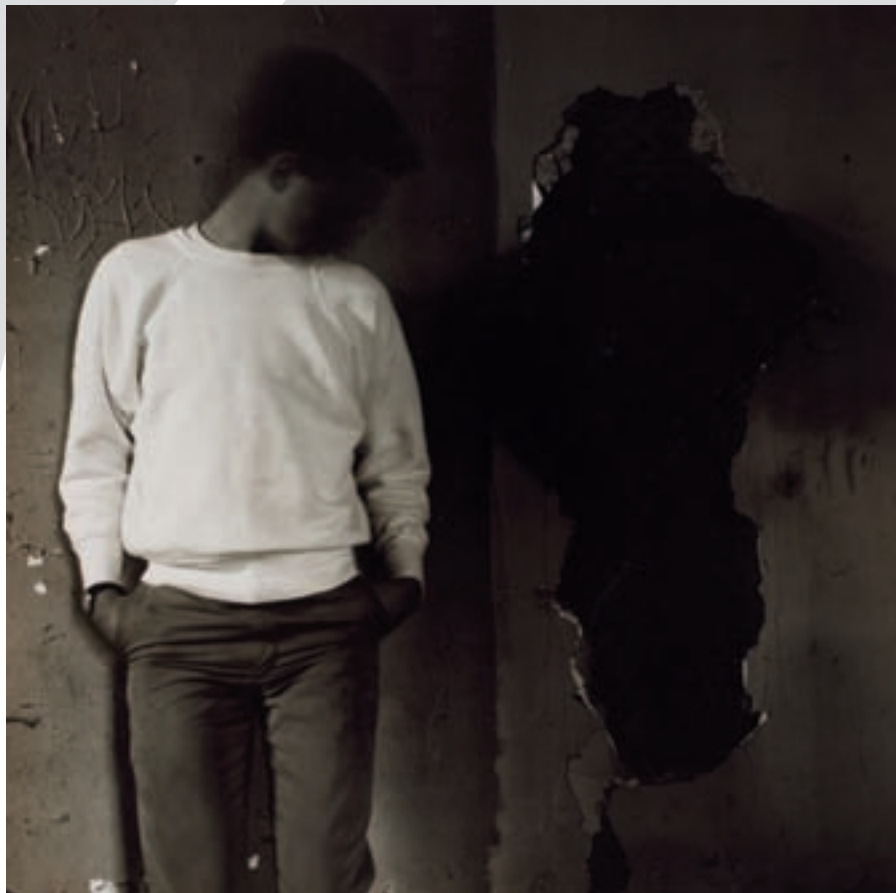
Ralph Eugene Meatyard, Untitled (1963), 19,1 × 19,4 cm. NGC. Purchased 2008 with the generous support of the Mark McCain and Caro MacDonald Photography Fund Ralph Eugene Meatyard, Sans titre (1963), 19,1 × 19,4 cm. MBAC. Acheté en 2008 grâce à l'appui généreux du Fonds Mark McCain et Caro MacDonald pour la photographie